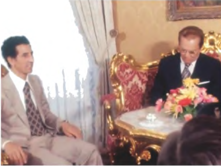
أثناء زيارة عبد السلام جلود ليوغسلافيا، وجانب من لقاءه الرئيس جوزيف تيتو، 1977.